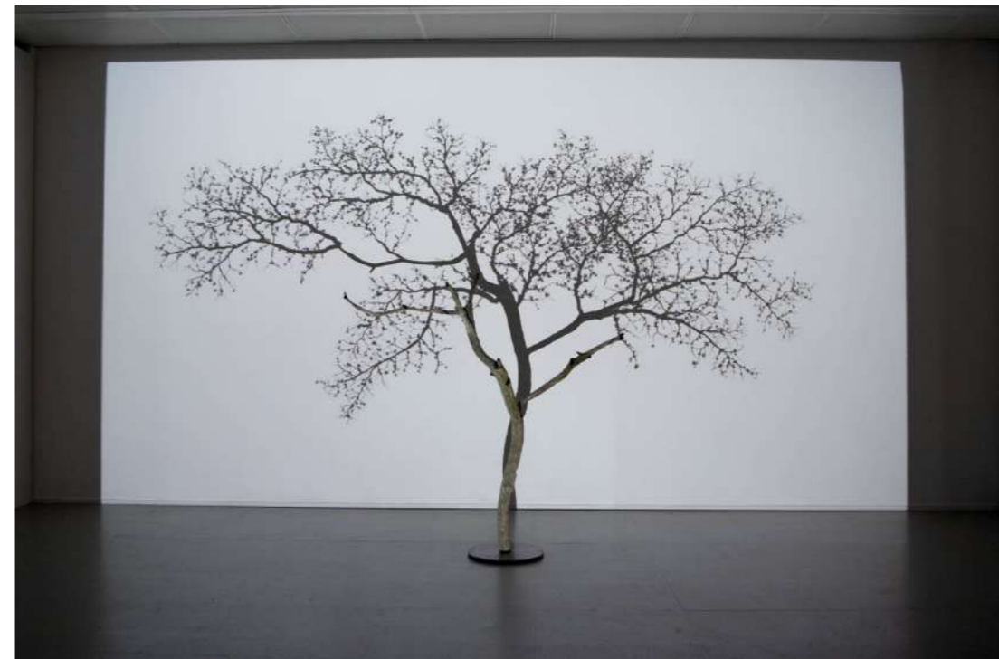
Samuel Rousseau, L'arbre et son ombre IV , 2013. Châtaignier, projection en boucle . Dimensions: H. 147 cm / L. 210 cm / P. 90 cm / Socle 35 cm.