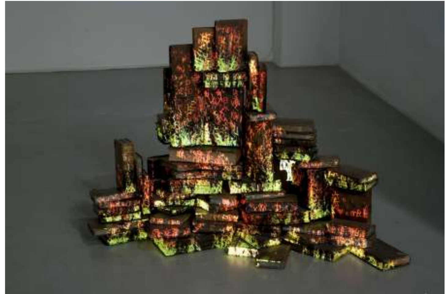
Samuel Rousseau, Autodafé , 2016. Vidéo projection HD, livres anciens, acier. 110×70×72 cm