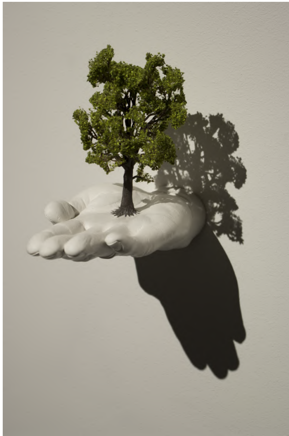
Samuel Rousseau, Renaissance , 2017. Plâtre de synthèse, arbre en plastique, acier, bois, peinture. 10×18×22 cm