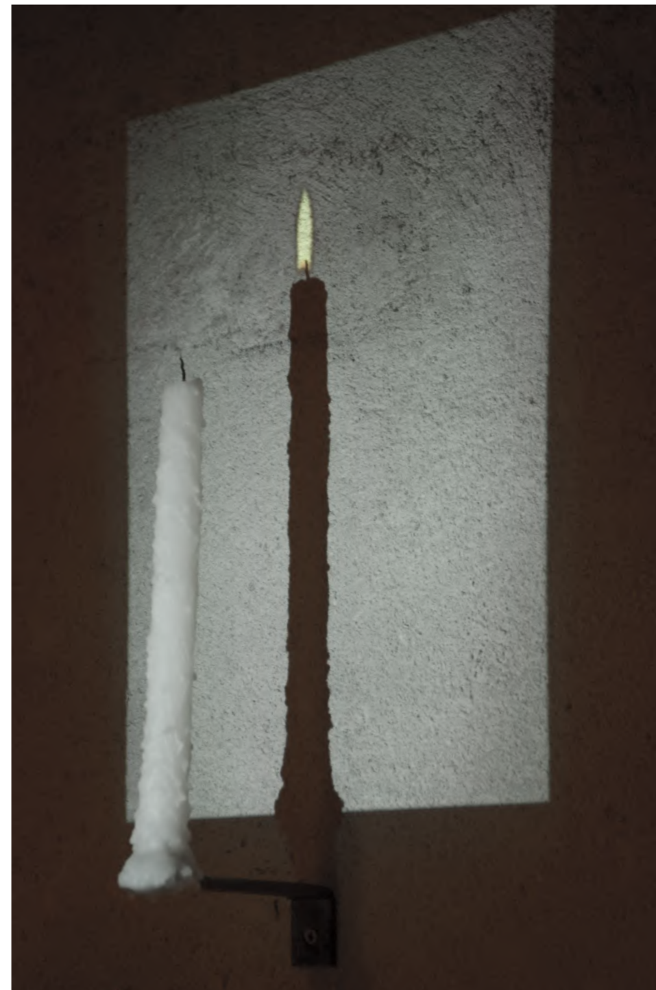
Samuel Rousseau, Un peu d'éternité , 2008. Vidéo projection, bois, bougie. Boucle de 11 min. 30×40×80 cm