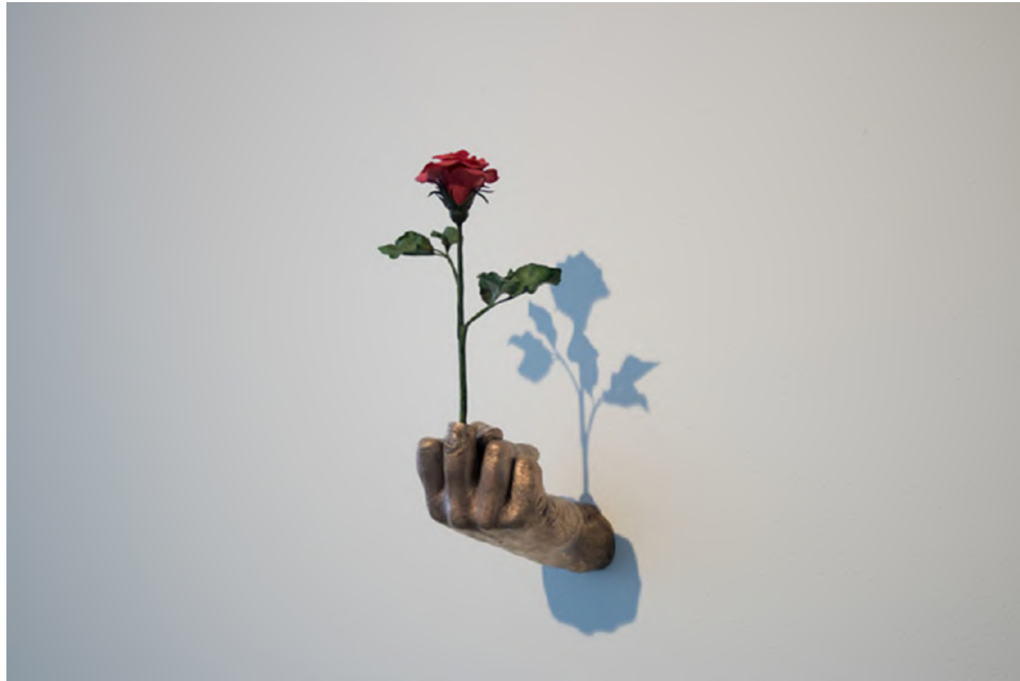
Samuel Rousseau, Tout mon amour , 2017 Bronze, porcelaine froide, peinture. 9×19×26 cm