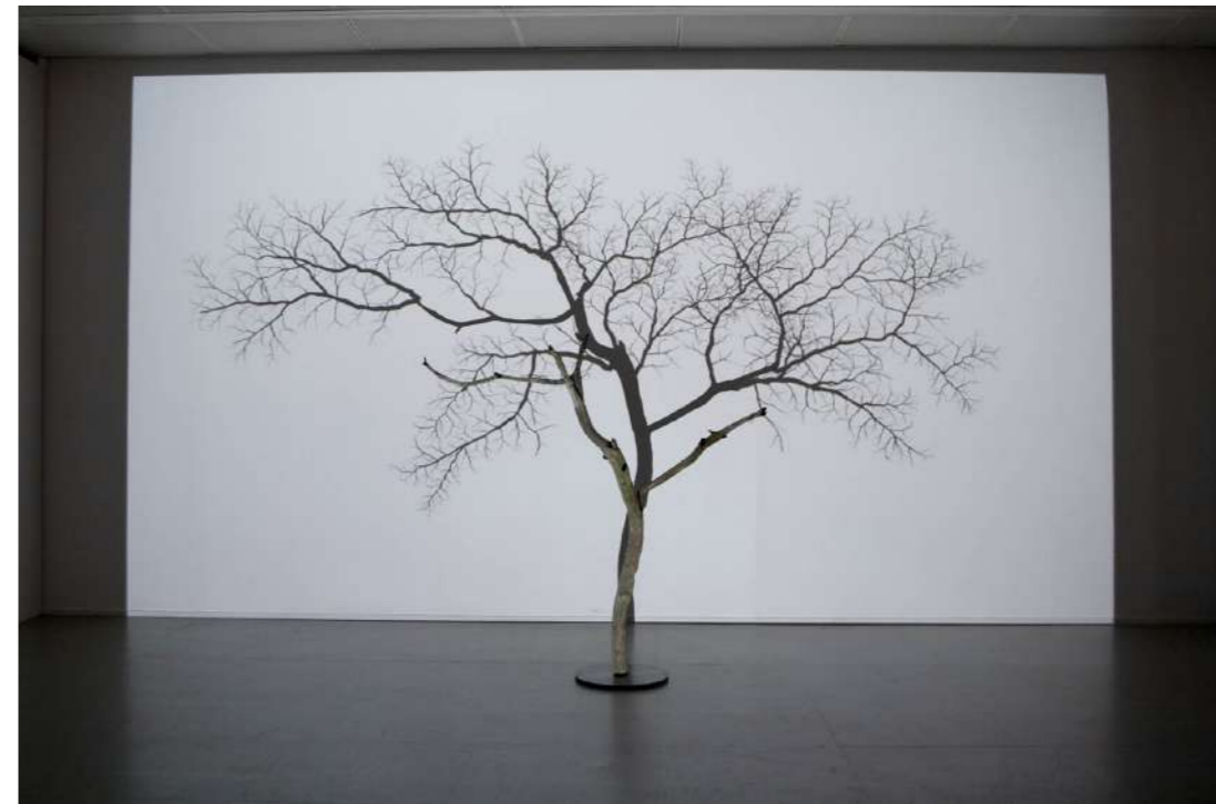
Samuel Rousseau, L'arbre et son ombre IV , 2013. Châtaignier, projection en boucle . Dimensions: H. 147 cm / L. 210 cm / P. 90 cm / Socle 35 cm.