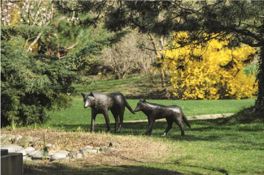
Loup et louveteau, Fondation Leonard Gianadda, Martigny, Suisse.