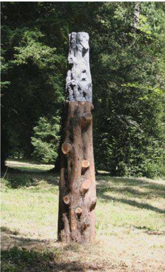
If_ 2004, If et ciment moulé, 250cmx45cmx37cm