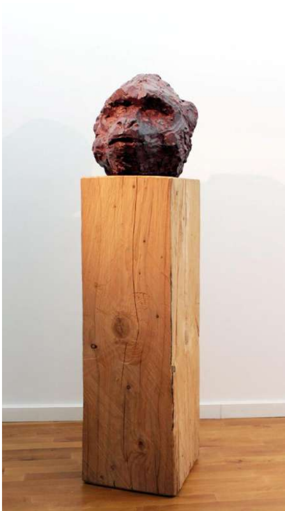
Tête de singe , 2009, Bronze, cèdre, 182 x 60 x45 cm.