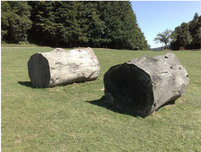
Moulage , 1993, Séquoia, ciment ,400x220cm – Centre national d'Art et du Paysage, Ile de Vassivière