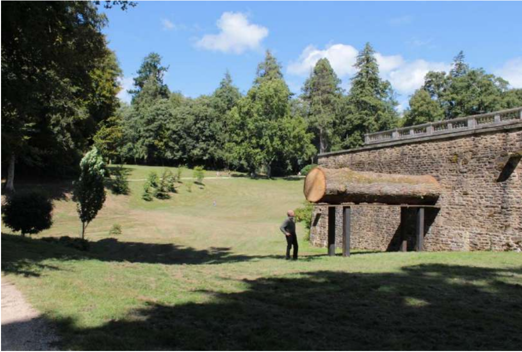
Chêne , 2014, chêne déraciné, 5,50mx3,20mx1,20m – Domaine de Kerguéhennec.