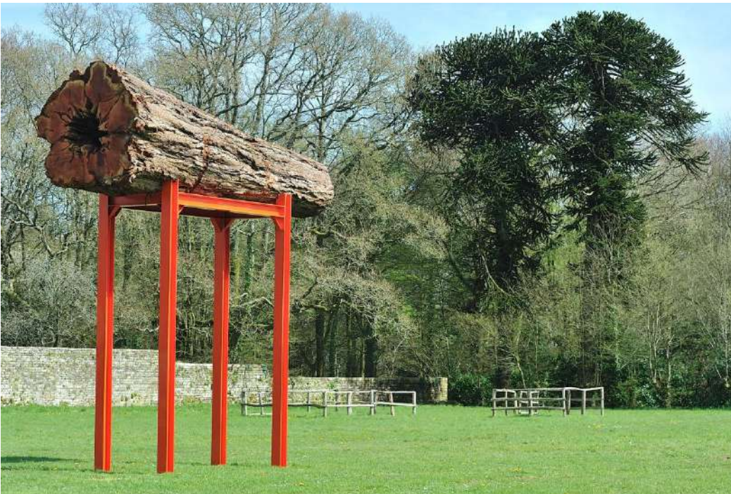
Le grand séquoia , 2013, séquoia et acier peint, 6,30x5,20x1,90m. Manoir de Kernault, Finistère.