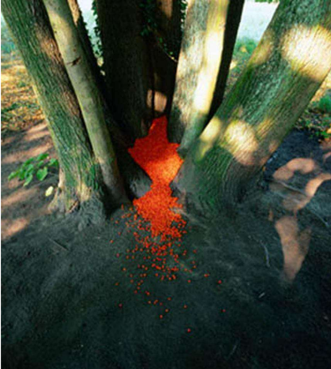
« Sans titre », 1999 Tilleuls, sorbes Aix-la-Chapelle, Allemagne Ilfochrome sur aluminium 100 x 90 cm N° 1/8