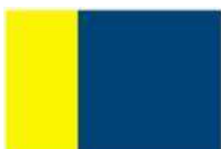
Commune Anglards de Salers