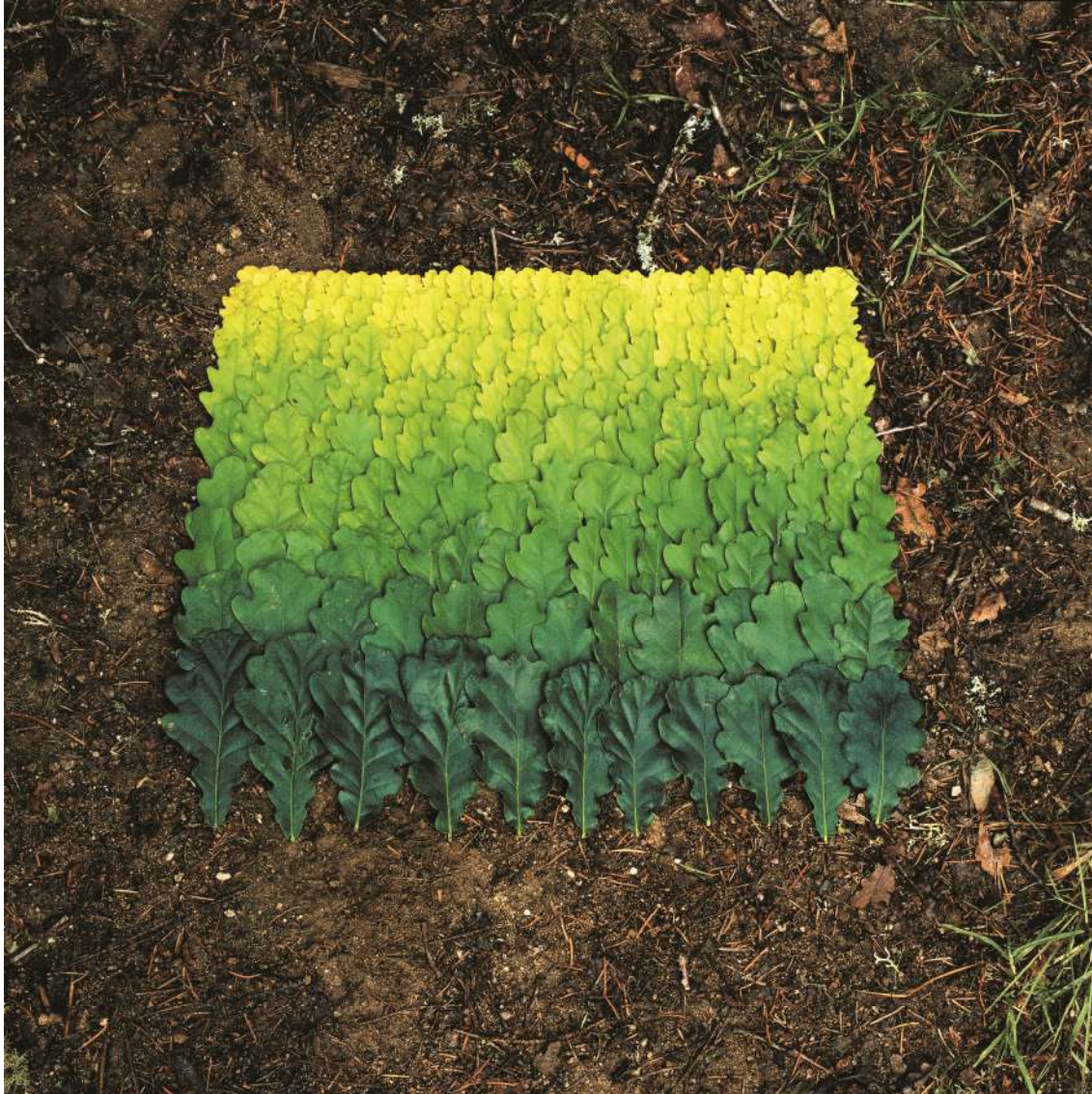
« Feuilles de chêne », 1986 Vassivière en Limousin, France Ilfochrome sur aluminium 100 x 100 cm 6/8