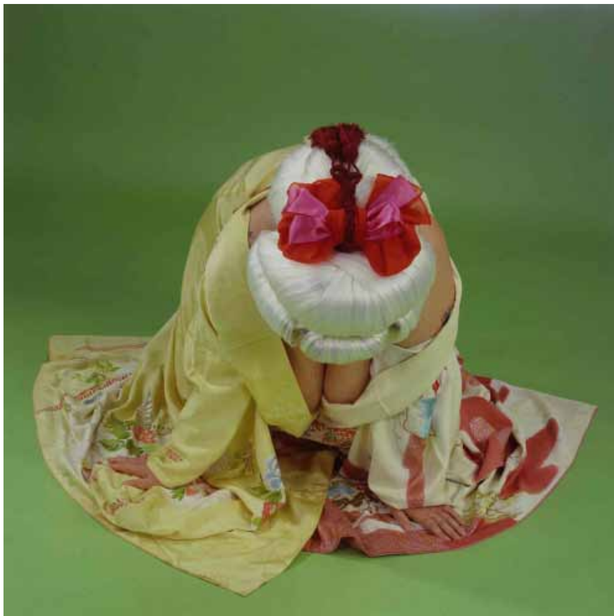
YBANA 2006, Tirage argentique cibachrome, 120 x 120 cm