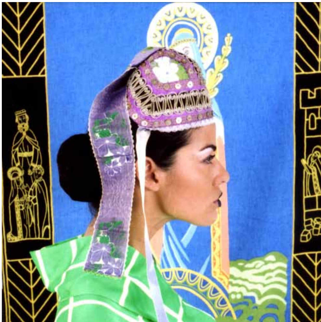
AZèl 2008, Tirage argentique cibachrome, 80 x 80 cm