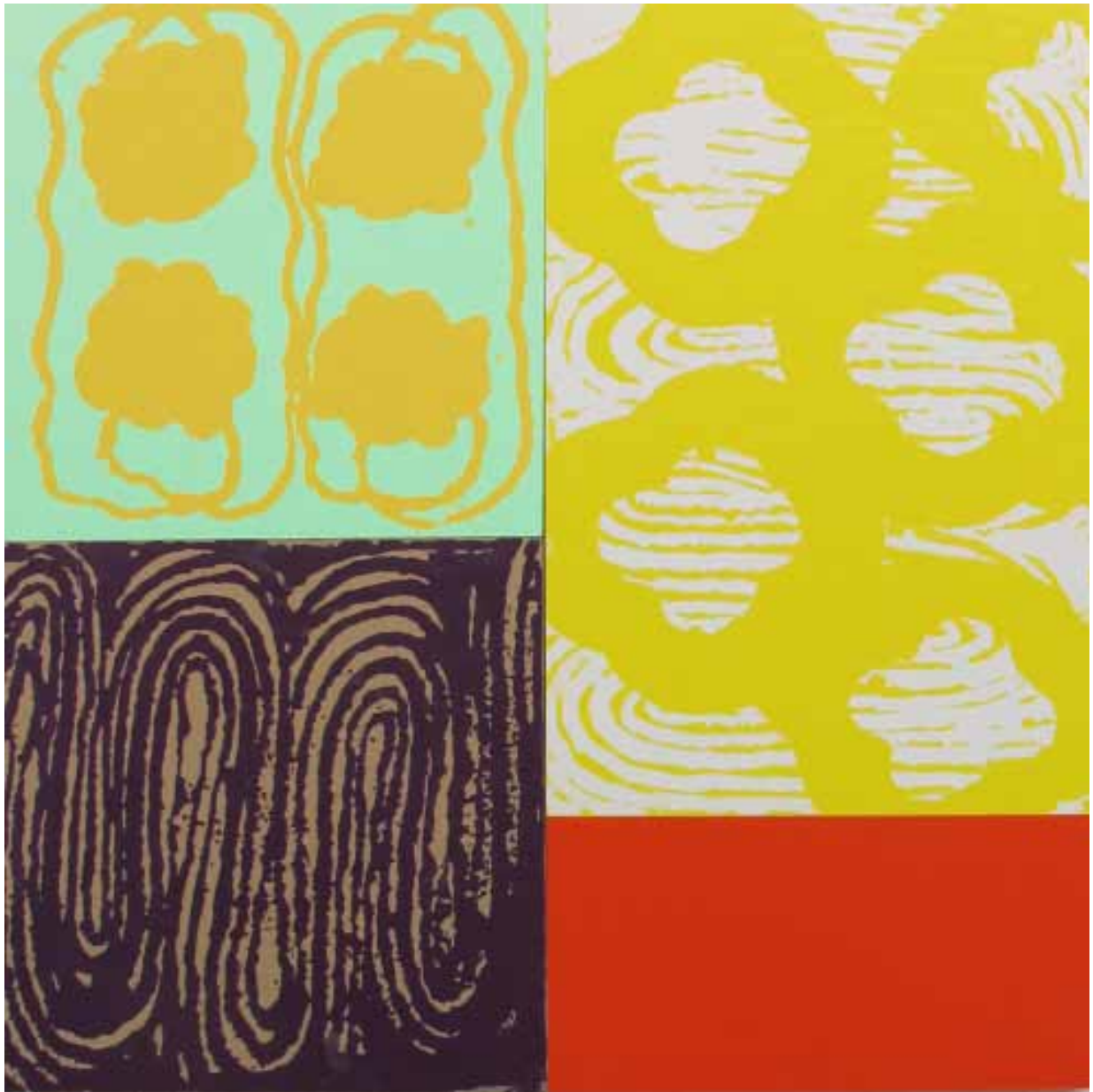
Babobi 2013, Pigments, résine sur bois, 100 x 100 cm