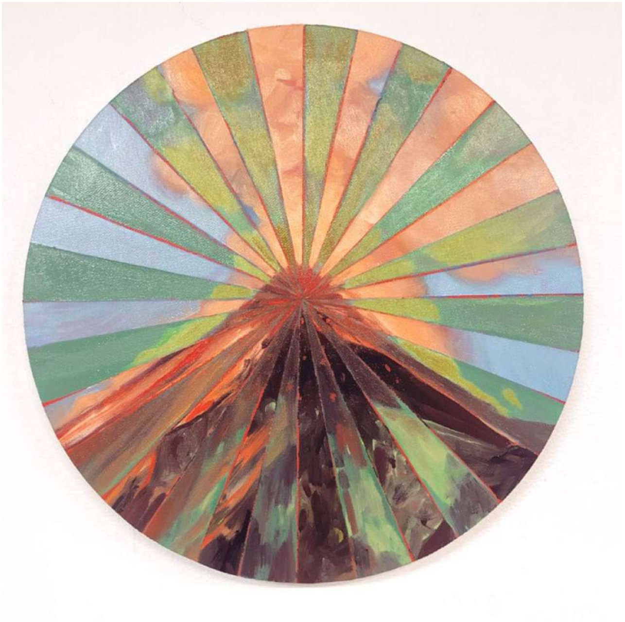
Le Mont Analogue, 2022 Huile sur toile 30 x 30 cm