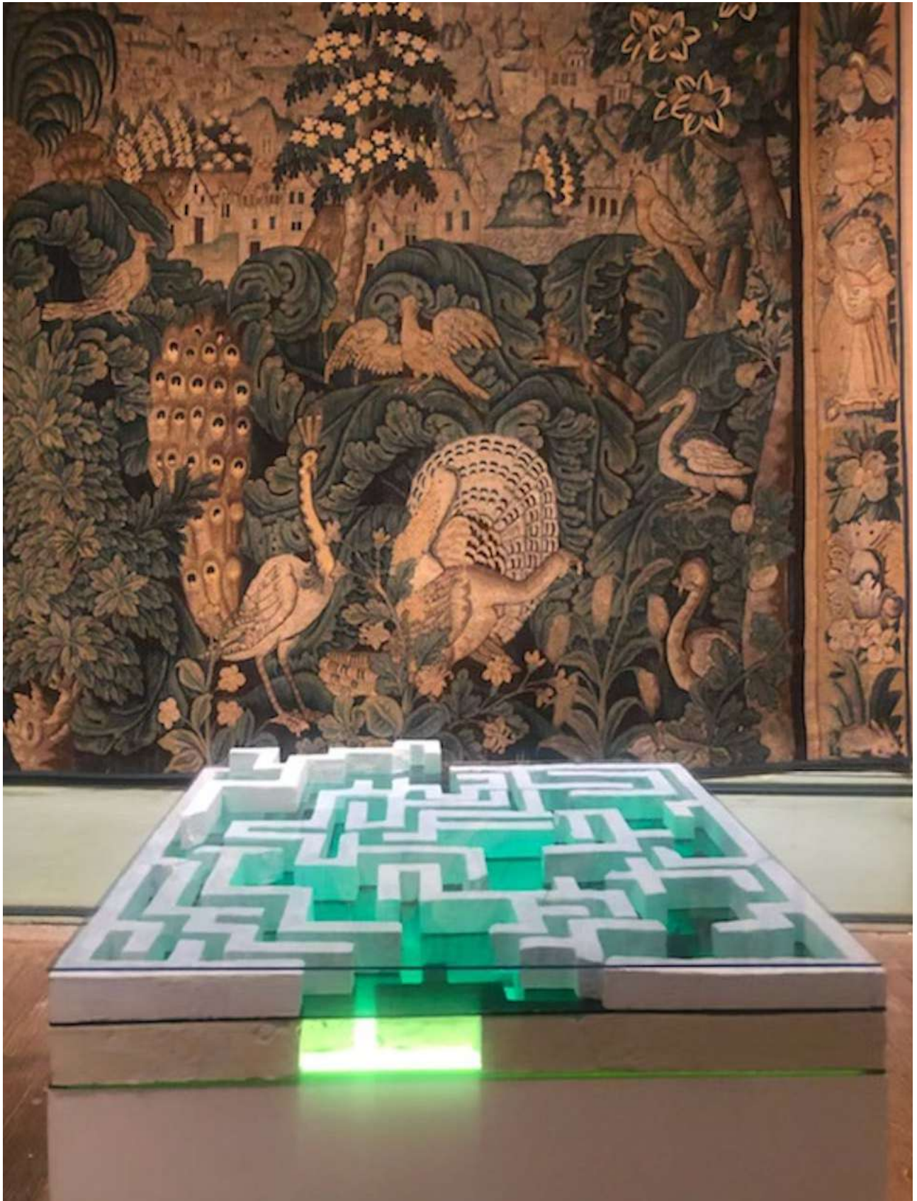
Vue d'exposition, Château de la Trémolière, 2022