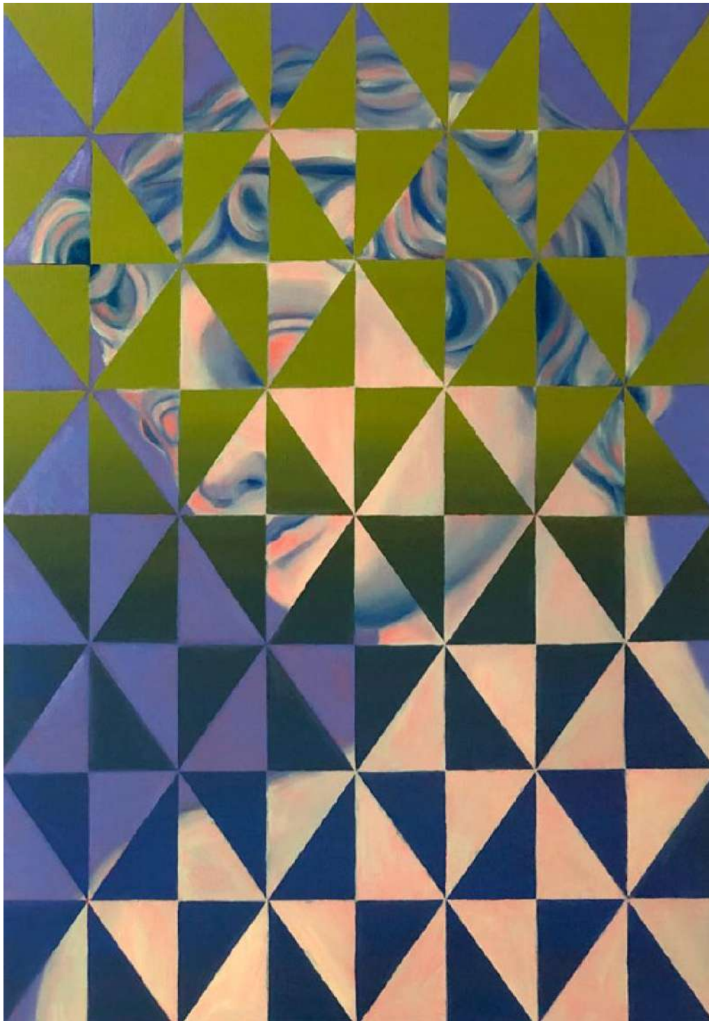
Antinous, 2022 Huile sur toile 103 x 70 cm