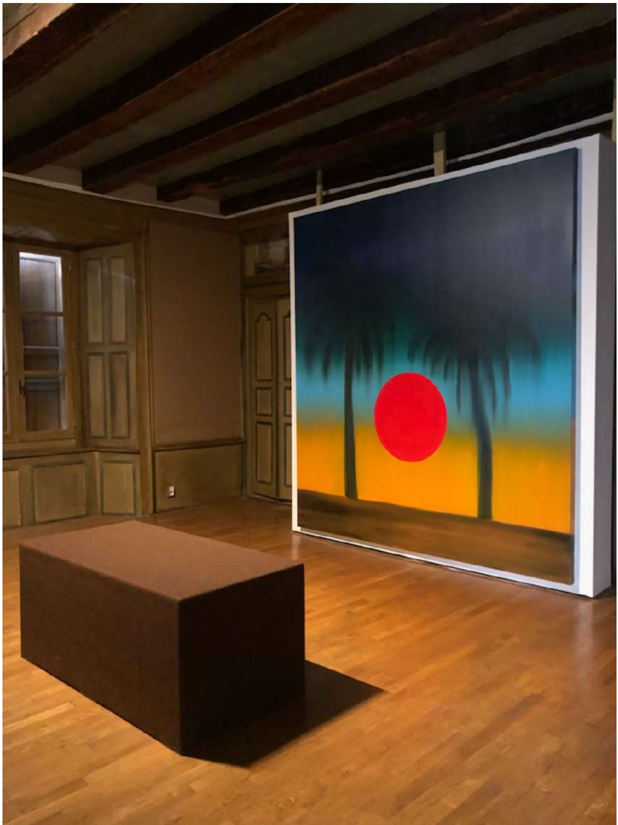
Vue d'exposition, Château de la Trémolière, 2022