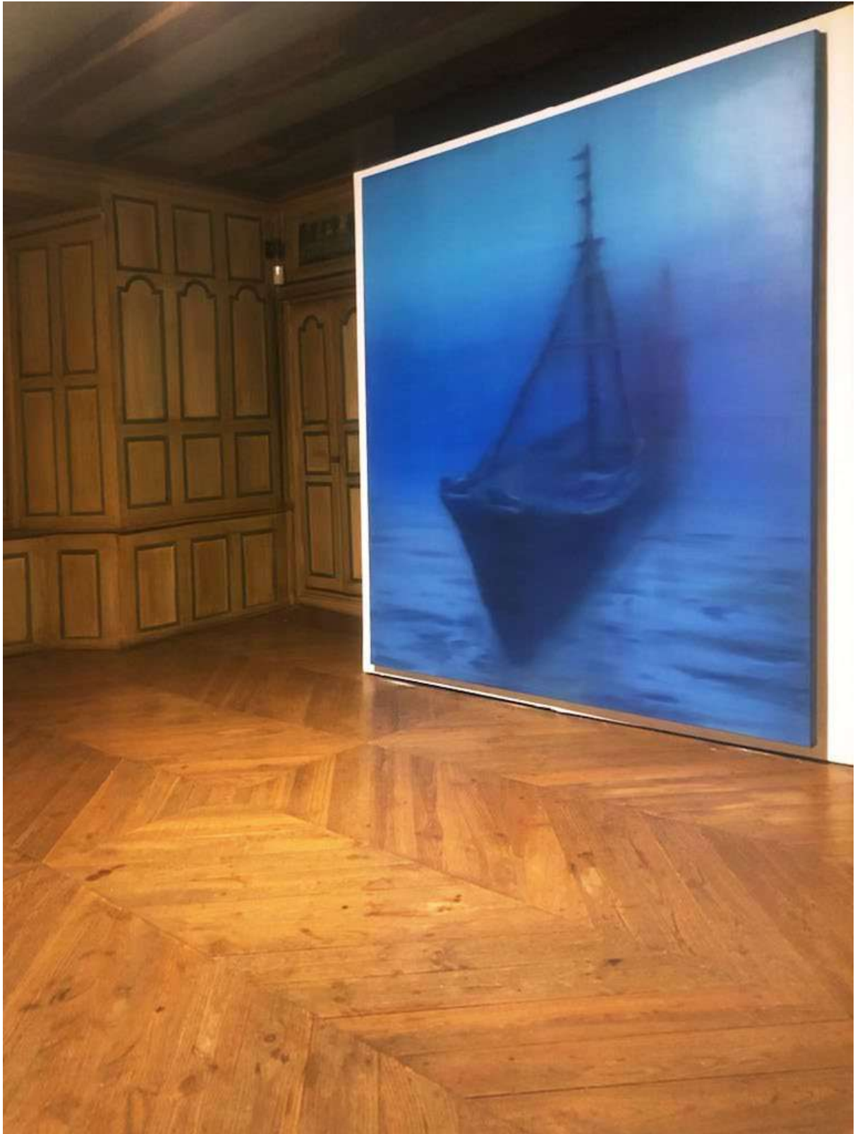
Vue d'exposition, Château de la Trémolière, 2022