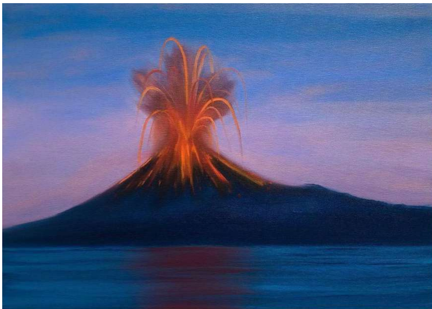
Triangle de Karpman, 2022