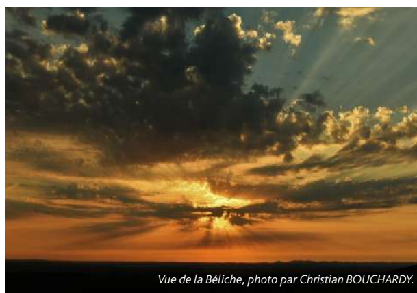
Vue de la Bélêche, photo par Christian BOUCHARDY.

Avec l'association « Découverte, Chemins et Patrimoine », une étude est en cours pour installer une série de plaques d'exposition « faune et flore » le long de la piste des montagnes. Elles seront mises en place l'année prochaine.