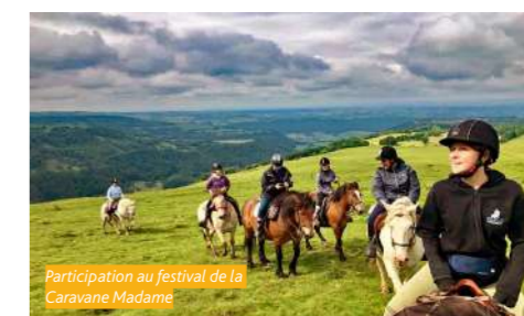
Participation au festival de la Caravane Madame