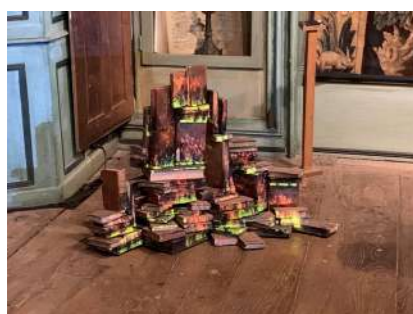
Samuel Rousseau, Autodafé (livres brûlants) , 2016. Vidéoprojection HD, livres anciens, acier.