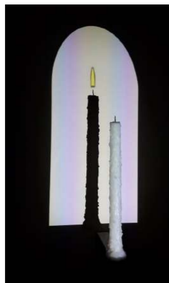
Samuel Rousseau, Un peu d'éternité , 2009. Vidéoprojection, bois, bougie. Boucle de 11 min.