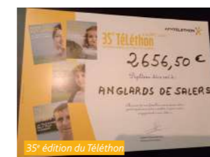
35 e édition du Téléthon