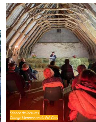
Séance de lectures Grange Mennesson du Pré Gras