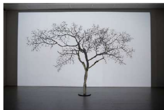
Samuel Rousseau, L'arbre et son ombre IV , 2013. Châtaignier, vidéoprojection en boucle de 13 minutes.