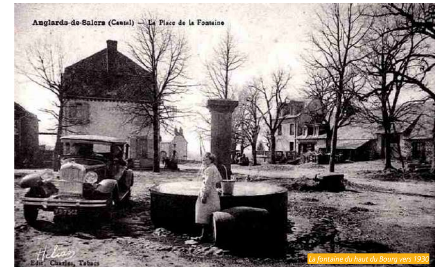
La fontaine du haut du Bourg vers 1930

En 1900, considérant que de nombreux cas de fièvre typhoïde s'étant produit dans le Bourg d'Anglards, le médecin des épidémies fut chargé de procéder à une enquête sur les causes de la maladie et qu'il fut démontré que cette épidémie était occasionnée par la mauvaise qualité des eaux, servant à l'alimentation des habitants. A la suite de cette enquête, le Conseil d'hygiène de l'arrondissement, dans sa séance du 1 août 1900, fit connaître que l'eau des fontaines d'Anglards était impropre à la consommation, et qu'il y avait lieu de rechercher les moyens d'amener de l'eau potable dans cette localité.